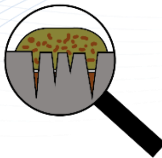
Mitrināšana ar "klasiskiem" tīrīšanas līdzekļiem