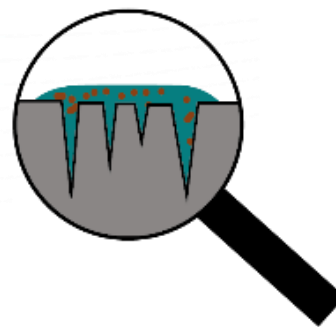
Īpaši mitrinoša iedarbība